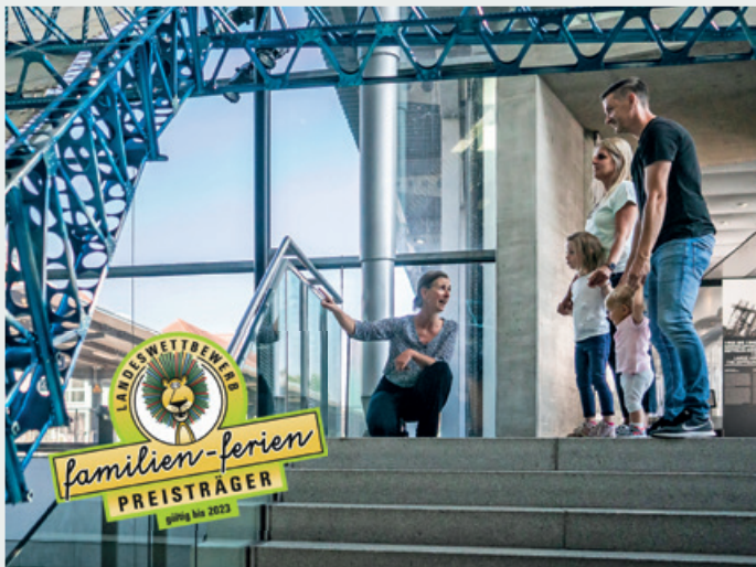
Titel: Archiv der Luftschiffbau Zeppelin GmbH, S. 1/2 Ldbuero, S.3 Denger, S.4,5 Tretter, S.7/8 unten Myrzik, S. 9 Mare Clausum – The Sea Watch vs Libyan Coast Guard Case (Video 2018). Forensic Oceanography and Forensic Architecture, S.11: Hardt, Karl Heinz: Von Luftschiffen und Ballons : Luftfahrzeuge mit Geschichte und Zukunft, Berlin-Kinderbuchverlag, Berlin, 1976, S.12: Timur Si-Qin: Campaign for a New Protocol, Part III, 2018, Mixed-media installation. Courtesy of the artist and Societe Berlin. Photograph by Rui Wu, S.13 Denger, andere Fotos: Zeppelin Museum Friedrichshafen

Abonnieren Sie unseren Newsletter unter: www.zeppelin-museum.de Subscribe to our newsletter: www.zeppelin-museum.de